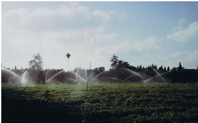
Bewässerung in israelischen Weingärten

Innerhalb relativ kurzer Zeit entwickelte sich die israelische Weinindustrie vom Hersteller einfacher Opferweine (sog. „Kiddusch-Weine“) zu einem angesehenen Mitbewerber auf dem Weltmarkt. Ein großer