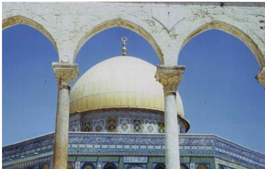
Felsendom in Jerusalem

Der Wein spielt bereits seit frühester Zeit in Mythologie und Religion eine wichtige Rolle. In der antiken Mythologie waren es die Götter Osiris (Ägypten), Dionysos (Griechenland), Bacchus (Rom) oder Gilgamesch (Babylonien) die den Wein bzw. Weingenuss repräsentierten.